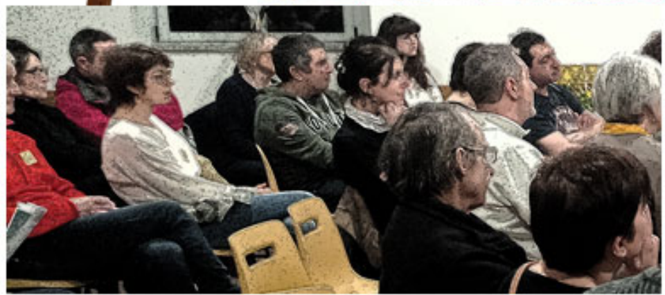
La réunion de vendredi 27 janvier 2023 à la mairie de Mirebel

Les membres de l'association ont présenté le projet de la fête médiévale du 9 juillet.